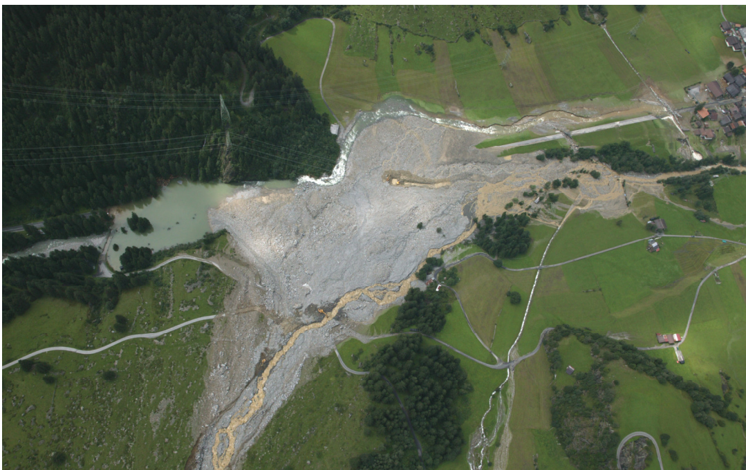
Murgang Rotloui, 2005.

In jüngerer Zeit sah sich Guttannen mit einem weiteren Element, dem Wasser konfrontiert. Am 22. August 2005 ereignete sich im Rotlouigraben ein Murgang , welcher die ganze Breite des Talbodens mit Ablagerungen von 500'000 m 3 überschüttete. Die dadurch gestaute Aare bahnte sich auf der linken Talseite ihren Weg und überflutete den Dorfteil Schattseite. Menschen und Tiere kamen keine zu Schaden. Die Schäden an Gebäuden und Kulturen dagegen waren gross, die Hilfe während der Überschwemmung und bei den Aufräum- und Instandstellungsarbeiten enorm. Einmal mehr durfte die Guttanner Bevölkerung die Solidarität vieler Mitmenschen spüren.