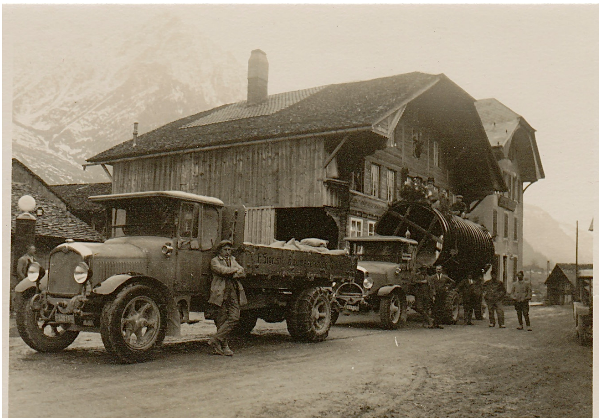
Schwertransport für den Kraftwerksbau an Grimsel und Gelmer im Jahr 1928, im Hintergrund das Hotel Bären.

Insgesamt wirteten sechs Generationen von Rufibachs im neuen und alten Bären (1806–2013) und erlebten dabei so einiges: Anfang des 19. Jahrhunderts war der Bären noch Zollstation , mit dem Bau der Passstrasse 1894 kamen die ersten Touristen ins Tal, ab 1921 fuhren zunehmend Postautos statt -kutschen durchs Dorf. Anfang des 20. Jahrhunderts begann der Kraftwerksbau an der Grimsel.