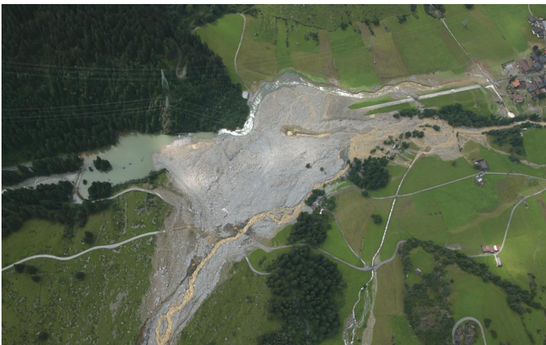
Murgang Rotloui, 2005.

In jüngerer Zeit sah sich Guttannen mit einem weiteren Element, dem Wasser konfrontiert. Am 22. August 2005 ereignete sich im Rotlouigraben ein Murgang , welcher die ganze Breite des Talbodens mit Ablagerungen von 500'000 m 3 überschüttete. Die dadurch gestaute Aare bahnte sich auf der linken Talseite ihren Weg und überflutete den Dorfteil Schattseite. Menschen und Tiere kamen keine zu Schaden. Die Schäden an Gebäuden und Kulturen dagegen waren gross, die Hilfe während der Überschwemmung und bei den Aufräum- und Instandstellungsarbeiten enorm. Einmal mehr durfte die Guttanner Bevölkerung die Solidarität vieler Mitmenschen spüren.